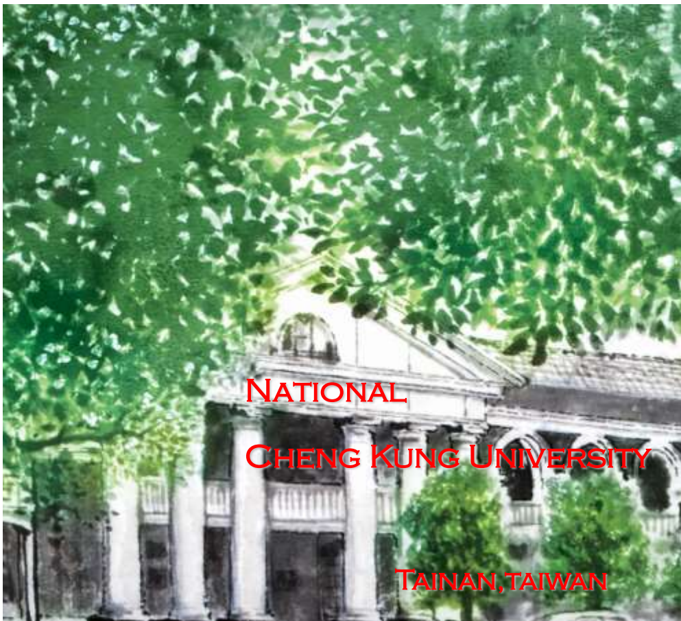
Painted by Prof. Chung-Ming Chiu (邱仲銘), Dept. of Geomatics, NCKU