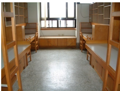
敬業一舍（大學部，男）