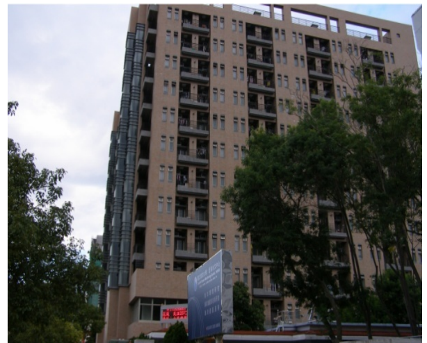
敬業三舍（研究生，男及女）