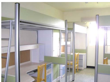
光復一舍（大學部，男）