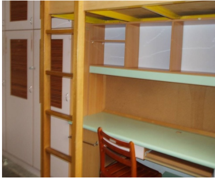
勝利二舍及勝利三舍（大學部，女）