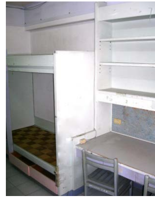
勝利八舍（大學部，女）