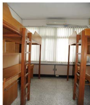
勝利一舍（大學部，男）