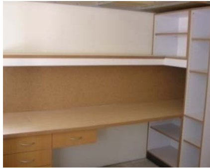
勝利九舍（大學部，女）