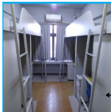
光復二舍（大學部，男）