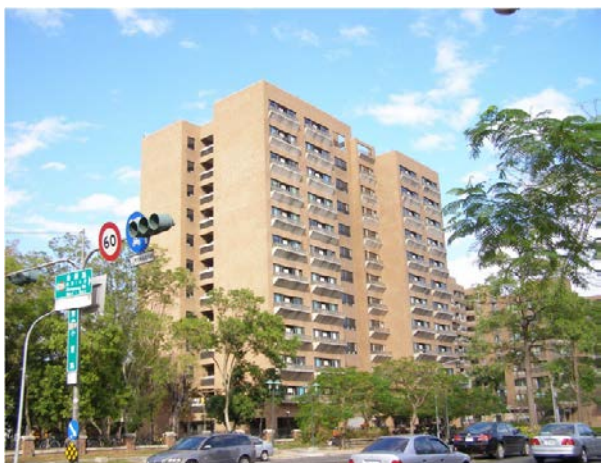
敬業一舍 (大學部, 男)