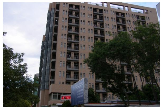
敬業三舍 (研究生, 男及女)