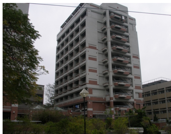
勝利八舍 (大學部, 女)