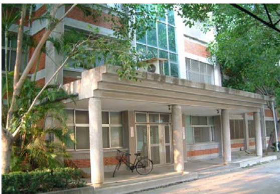
光復三舍 (研究生, 男)