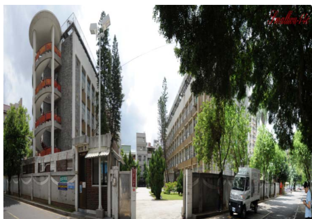
勝利二舍及勝利三舍 (大學部, 女)