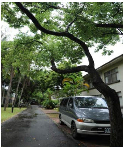
勝利四舍 (研究生, 男)