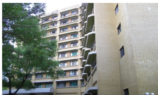
光復二舍 (大學部, 男)