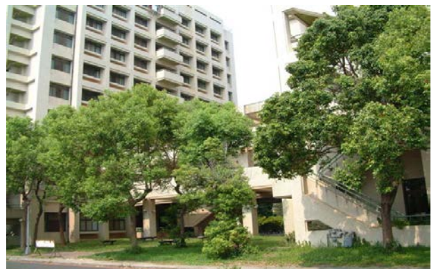
勝利六舍 (研究所, 男及女)