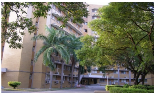
光復一舍 (大學部, 男)