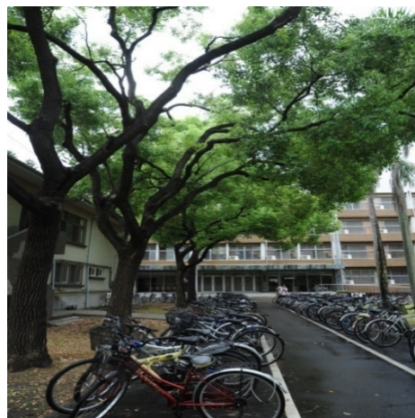
勝利一舍 (大學部, 男)