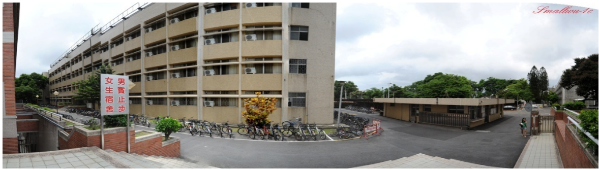
勝利九舍 (大學部, 女)