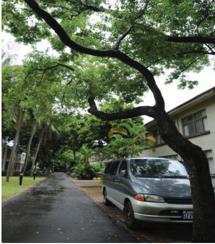
勝利四舍（研究生，男）