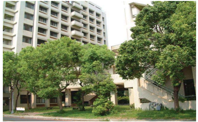
勝利六舍（研究所，男及女）