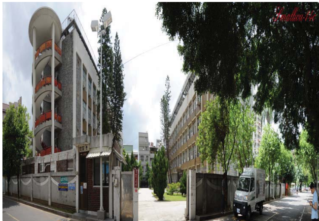
勝利二舍及勝利三舍 (大學部, 女)