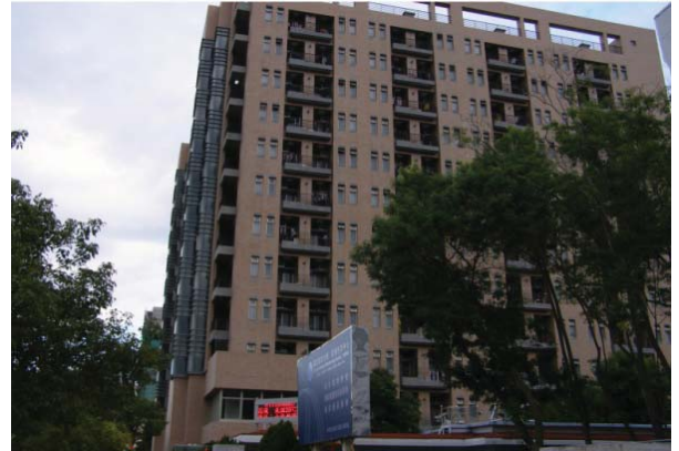
敬業三舍（研究生，男及女）