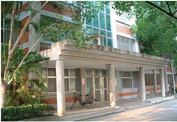
光復三舍（研究生，男）