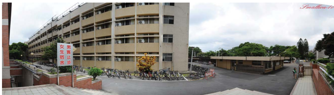
勝利九舍 (大學部, 女)