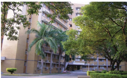
光復一舍 (大學部, 男)