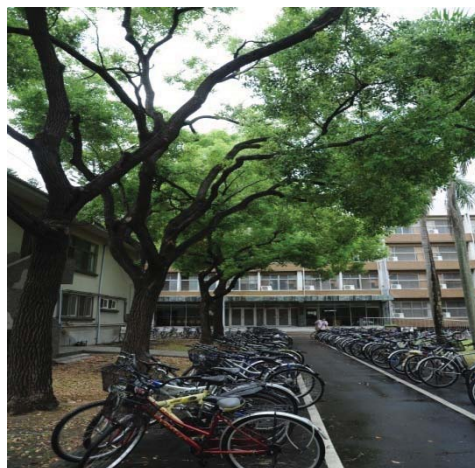
勝利一舍 (大學部, 男)