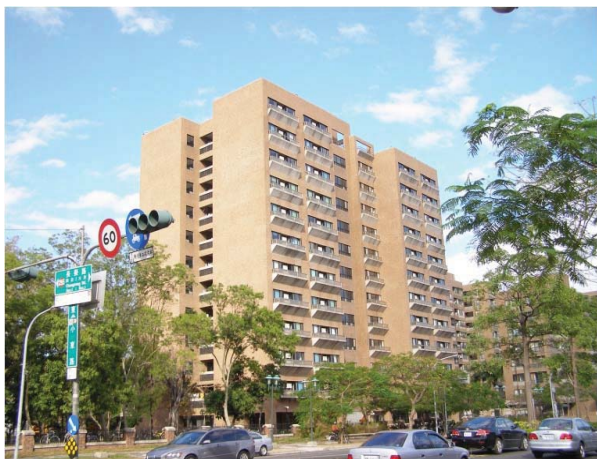
敬業一舍 (大學部, 男)