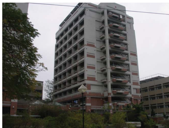
勝利八舍 (大學部, 女)