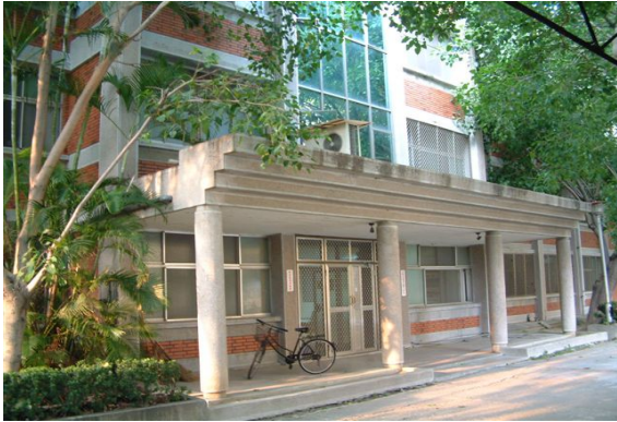
光復三舍（研究生，男）