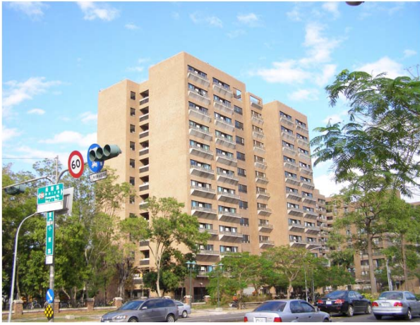
敬業一舍（大學部，男）