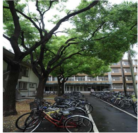
勝利一舍（大學部，男）