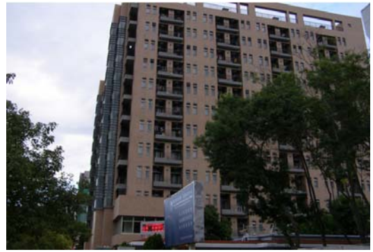
敬業三舍（研究生，男及女）