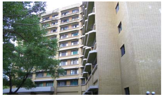
光復二舍（大學部，男）