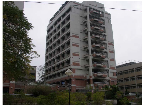
勝利八舍（大學部，女）