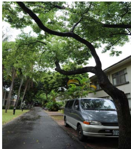
勝利四舍（研究生，男）