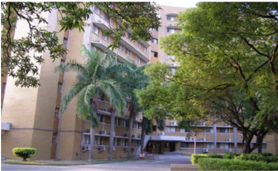
光復一舍（大學部，男）