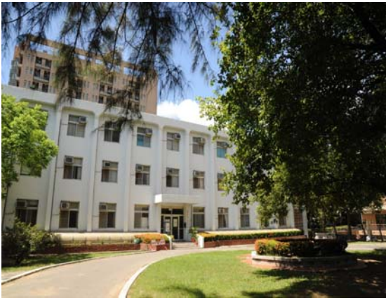
敬業二舍（研究生，男）