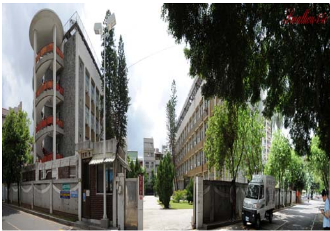
勝利二舍及勝利三舍（大學部，女）