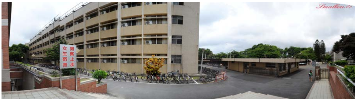
勝利九舍（大學部，女）