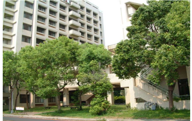
勝利六舍（研究所，男及女）