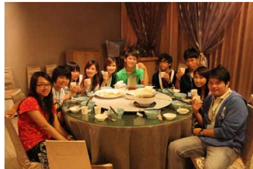
成大、台大僑生愉快的交流

當我們回到學校時，中興師生已來到，在寒暄一番後，立即進行分組，成大幹部熱情的為兩校師生進行校園導覽，此時雖然豔陽高照，但對於初次來到成大的同學而言，美麗的校園風光以及成大僑生的熱情魅力無法擋，大家仍甘願頂著大太陽，緊緊把握住在成大校園的每一刻及每一隅，留下美麗的回憶。