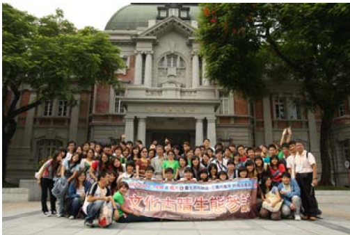
國立台灣文學館前合照

成大的僑生幹部，懷著既期待又興奮的心情，在小東路的高鐵公車接駁站迎接遠道而來的台大師生一行 13 人，為把握時間，兩校的成員介紹就在遊覽車上愉快的展開，一開始大家都還有點靦腆，但藉由參訪台南府城古蹟中彼此的互動，漸漸的大家開始打破沉默，午餐時我們也特地安排每桌都有成大與台大同學，在品嚐台南小吃之餘，就這樣大家開始天南地北的分享，不管是在台生活經驗、擔任幹部的成長心路歷程、各僑居地的文化背景.....等都聊得很盡興，差點忘了還要回到學校來歡迎中興的師生們。