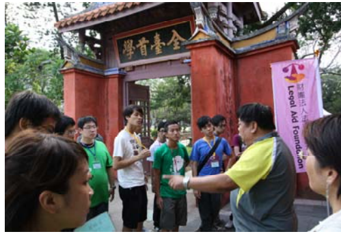
台南孔廟為台灣第一座孔子廟