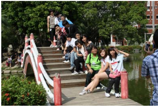
中興的同學們流連忘返於成功湖畔