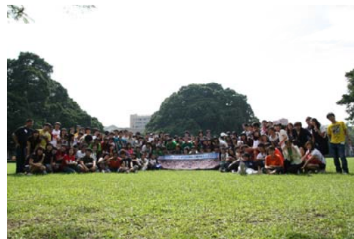
三校互相交換紀念品，並在榕園大合影

下午照著既定行程參訪大南門、碑林、孔廟、安平樹屋等古蹟，行程雖匆匆，但豐盛的府城之旅，充實了每個僑生的心。在話別前，三校僑生依依不捨互留聯絡方式，並邀約對方到自己的學校一遊，看到此情此景，顯然這次交流目的已達成。身為主辦單位的我們，也樂於替僑生同學們搭起友誼的橋樑。