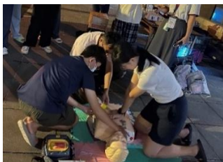
敬三舍居民實際操作

些知識和技能無疑將在真正的災害發生時發揮關鍵作用。地震等自然災害的發生無法預測，唯有平時的準備和定期的演練，才能確保所有人在危急時刻做出正確的反應。每一年的演練期待可提高居民對地震風險的認識，更培養了面對緊急情況時的冷靜應對能力。