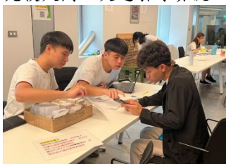
幹部引導新生辦理入住手續