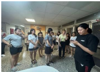
講解宿舍內逃生路線

透過此次導覽，讓勝九宿舍新生不僅熟悉日常生活中需要注意的各項規定與設施，還能在面臨突發事件時做出正確的應對，顯著提升了宿舍的整體安全和生活便利性。