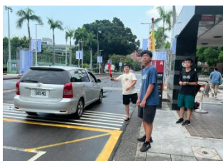
光復大門口交通引導實況

此 2 日進住服務期間共計 2,426 名新生完成進住，總入住率為 81.5%。