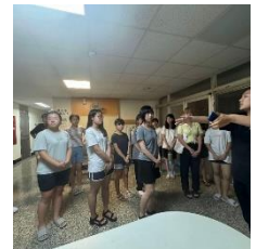
新生認真聽舍長解說