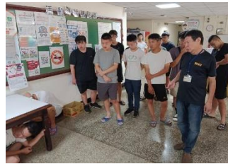
勝一舍-地震防災宣導