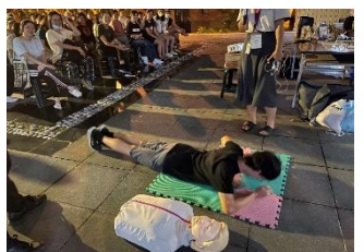
敬三舍演練睡覺時地震應變