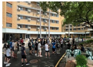
住宿生及清潔人員共同演練