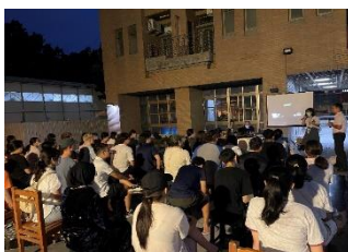
敬三舍防災事項(英文)宣導 CPR 及 AED 使用教學