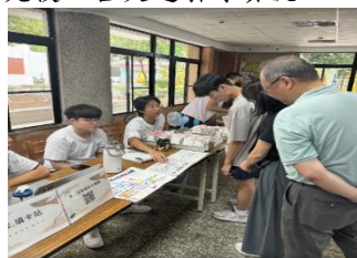
幹部引導新生辦理入住手續