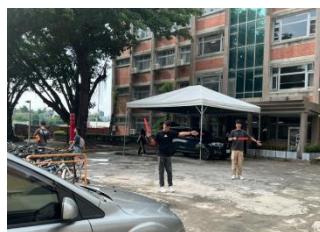
光復三舍交通引導實況