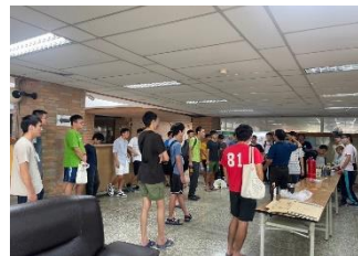
敬一舍講師說明防災事項