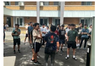
住宿生與講師會後交流