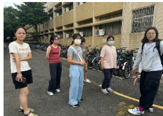
講解宿舍內腳踏車停放位置