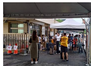
勝利八九舍人員管制實況