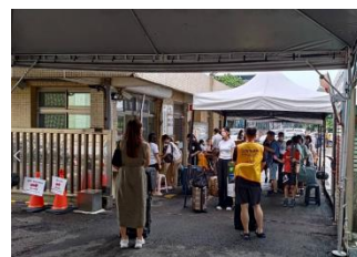
勝利八九舍人員管制實況