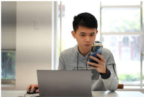
成功大學「NCKU Future Success+ 個人化學職涯規劃系統」從使用介面到系統功能都強調提供以學生為主體的互動式資訊整合服務，目標希望幫助在校學生更加順利接軌學涯與職涯