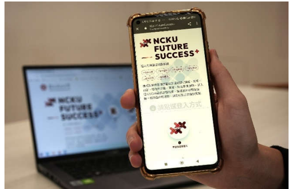
「NCKU Future Success+ 個人化學職涯規劃系統」彙整選課、成績、工讀、獎學金等眾多記錄，也能透過照片記錄個人校園生活日常，不僅可以探索個人興趣與分析職能，還能編修自傳、生成簡要履歷，學職涯一站式資訊整合功能，獲得學生好評

索歷程中，很難有系統地去歸類擅長與不擅長的方向，透過系統中職業興趣探索功能，能更加清楚地了解自己的長處與短處。