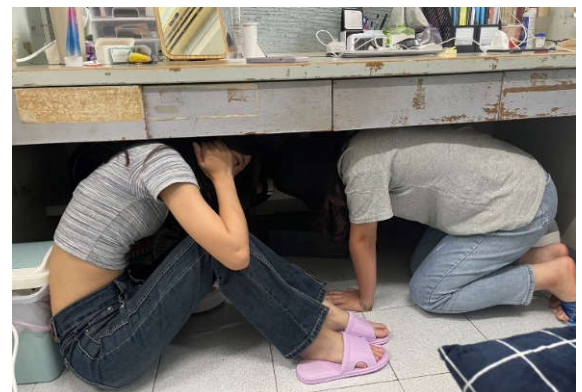
勝八舍人員確依趴下、掩護、穩住 3 個要領動作完成演練