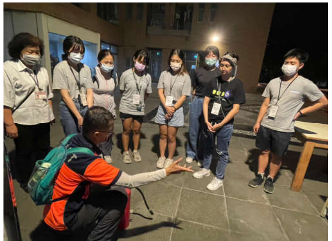
敬三舍學生幹部及保全教育訓練