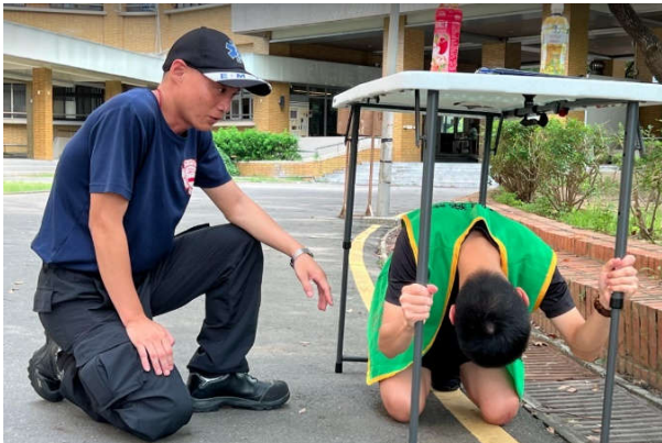
講師指導宿舍幹部正確姿勢

此活動依國家級警報之指示，聞警報聲時引導住宿生先原地避難，兩分鐘後模擬地震主震甫過但建築體恐有毀壞之風險，請住宿生儘速逃生至宿舍外空地。於住宿生集合時，特請台南市消防隊兩位資深講師解說及傳授地震逃生相關知識。此活動含宿舍服務人員、清潔人員及保全人員共約 200 人參與。