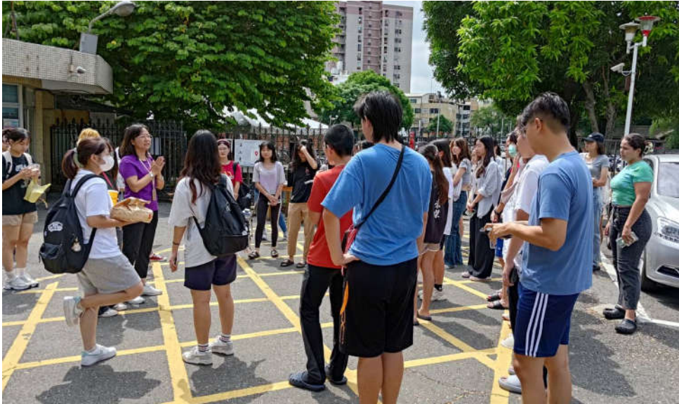
勝利舍區防災教育宣導