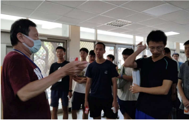
勝一舍防災教育宣導