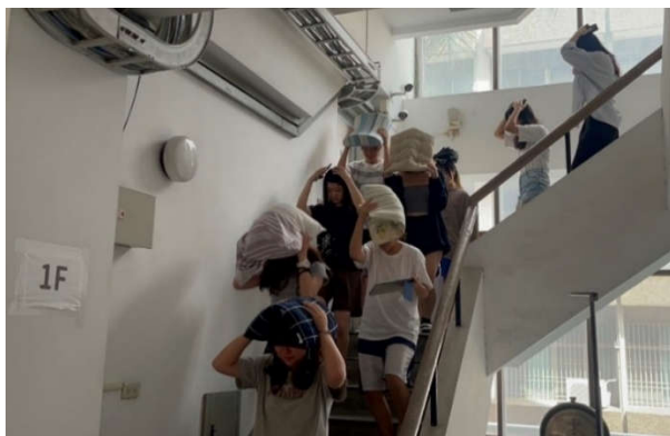
勝八舍住宿生依規劃路線疏散