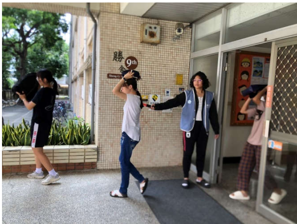
勝九舍住宿生依規劃路線疏散