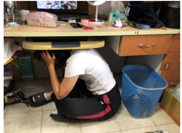
勝九舍人員確依趴下、掩護、穩住 3 個要領動作完成演練