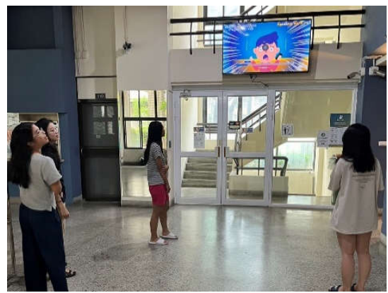
勝六舍住宿生觀看防災宣導影片