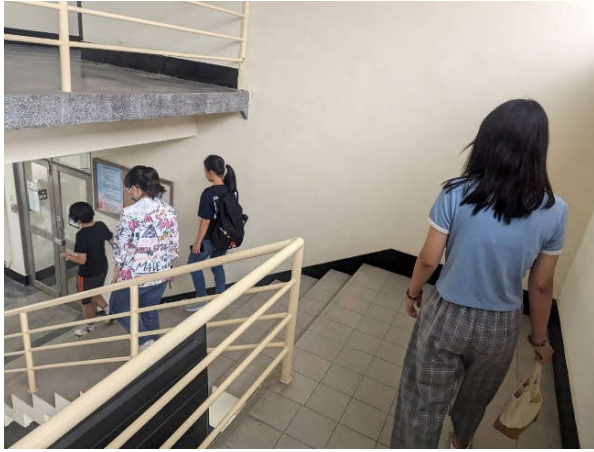
勝四舍住宿生前往勝利舍區避難點集合