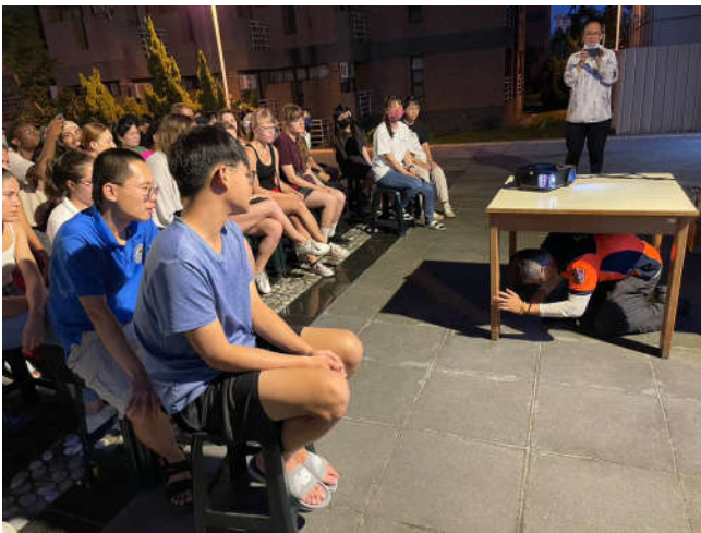
敬三舍現場中文直譯英文消防講解