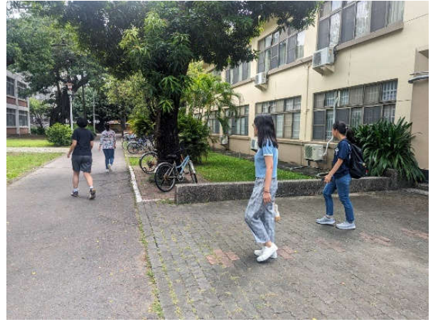
勝四舍住宿生前往勝利舍區避難點集合