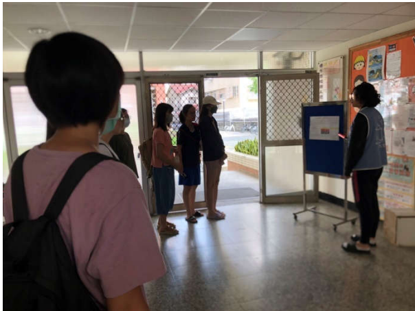
勝九舍防災教育宣導