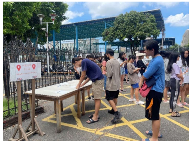
勝利舍區集合點進行人員清查