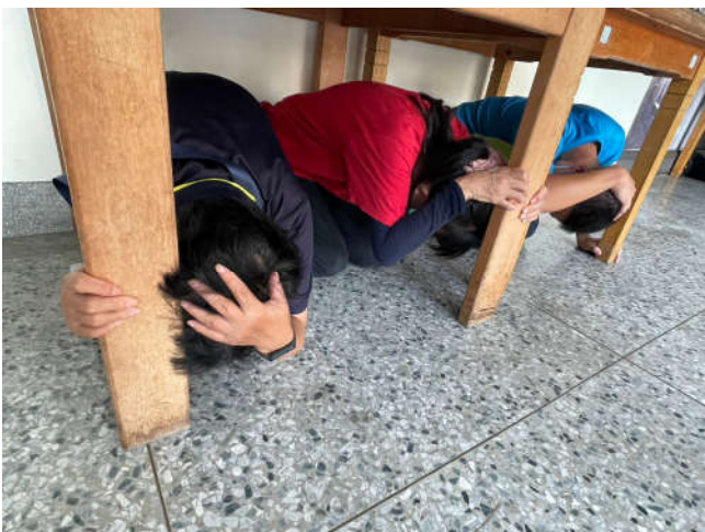
敬三舍現場學生操作演練