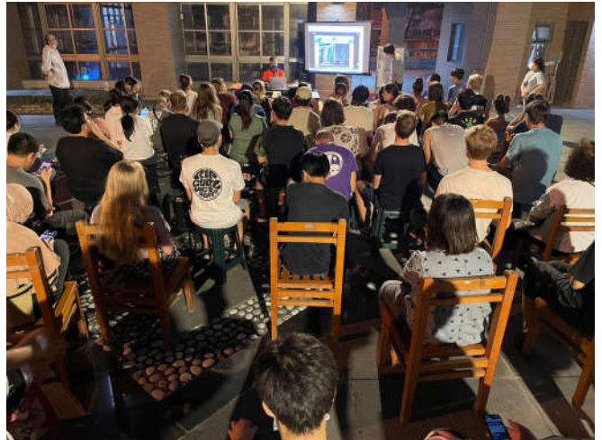
敬三舍現場中文直譯英文消防講解