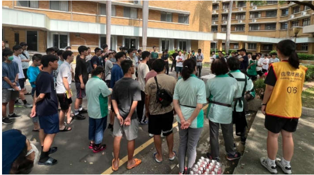
講師指導逃生要點

此活動依國家級警報之指示，聞警報聲時引導住宿生先原地避難，兩分鐘後模擬地震主震甫過但建築體恐有毀壞之風險，請住宿生儘速逃生至宿舍外空地。於住宿生集合時，特請台南市消防隊兩位資深講師解說及傳授地震逃生相關知識。此活動含宿舍服務人員、清潔人員及保全人員共約 200 人參與。