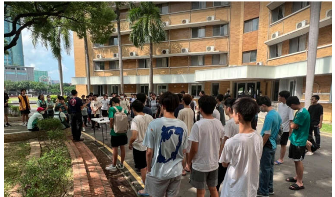
講師指導逃生要點