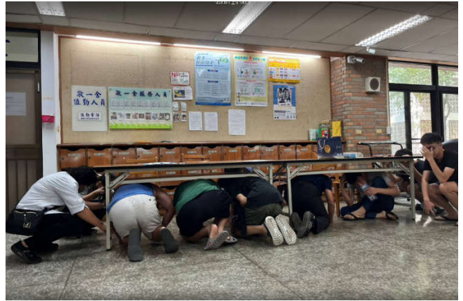
敬一舍講師指導宿舍幹部正確姿勢