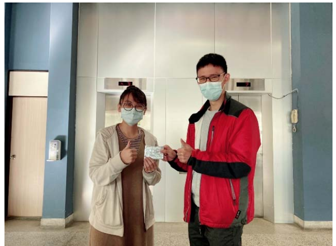
獲獎居民(左)與宿舍服務人員(右)合影紀錄